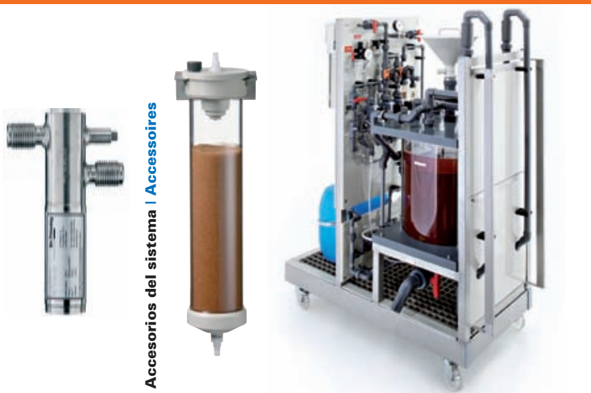
Accesorios del sistema | Accesorios